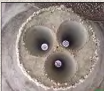
Exterior do sensor está coberto de pó, enquanto as propriedades autolimpantes mantêm os transdutores limpos e funcionais.