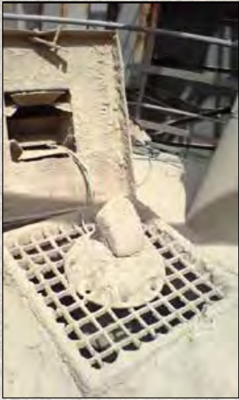
Sensor totalmente operacional em silo de cimento, apesar da poeira agressiva.