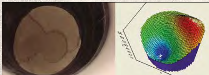
Detecta topografia irregular e a reflete em uma imagem 3D.

Não é necessário purga de ar para autolimpeza os transdutores resistem ao empoeiramento